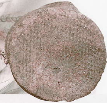
初あとと庄痕(底部) 山形市代山遺跡