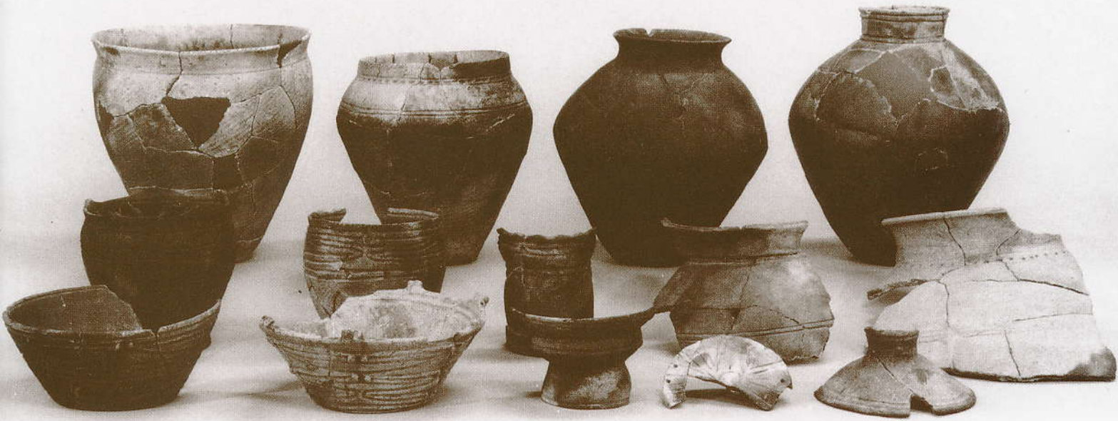
酒田市生石2遺跡