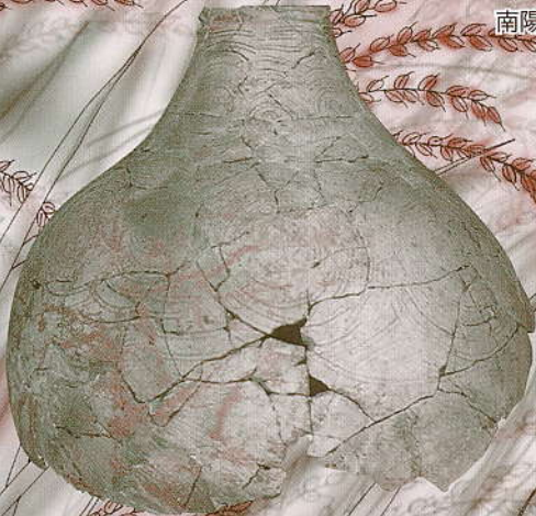
山形市平手堂・南河原遺跡