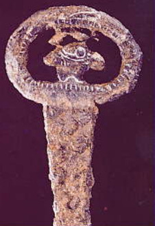
単風式環頭 (山形市大之越古墳出土)

開館時間 午前9時～午後4時30分 ※11月1日より午前9時30分～ 休館日 月曜・祝祭日※文化の日無料開館 入館料 大人200円、学生・小人100円 ※第2・4土曜日小・中・高生無料