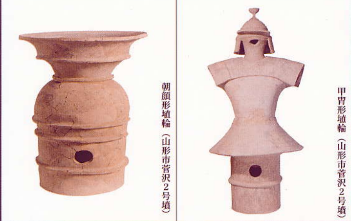
朝顔形埴輪 (山形市菅沢2号墳)