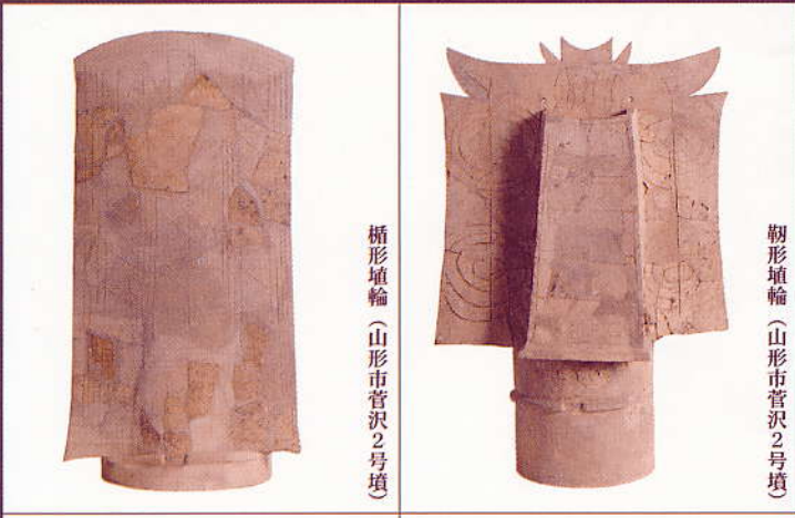
楯形埴輪 (山形市菅沢2号墳)