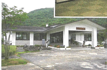
ふくげんじゅうきょく 押出遺跡の復元住居と暮らし ようす しょうせつてんじ の様子が常設展示されています