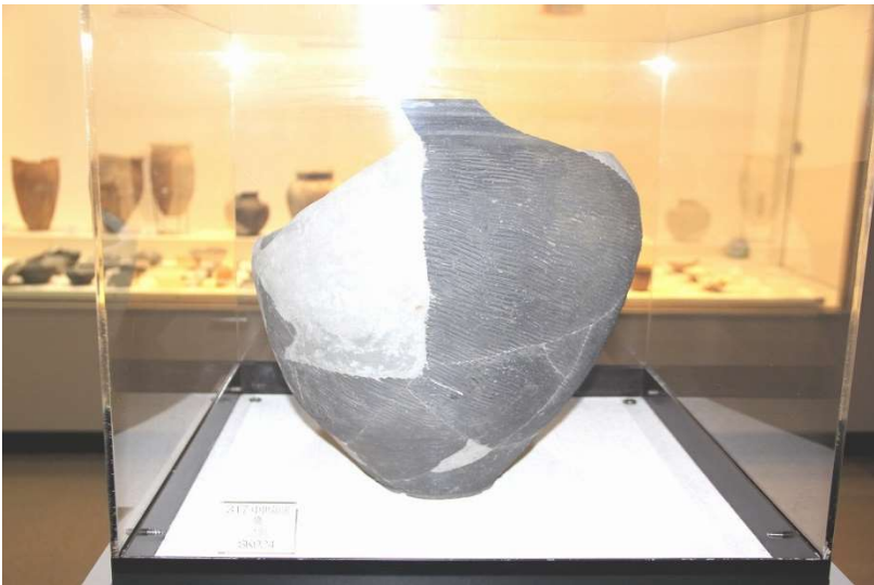
高瀬山遺跡から出土した珠洲の中世陶器です。