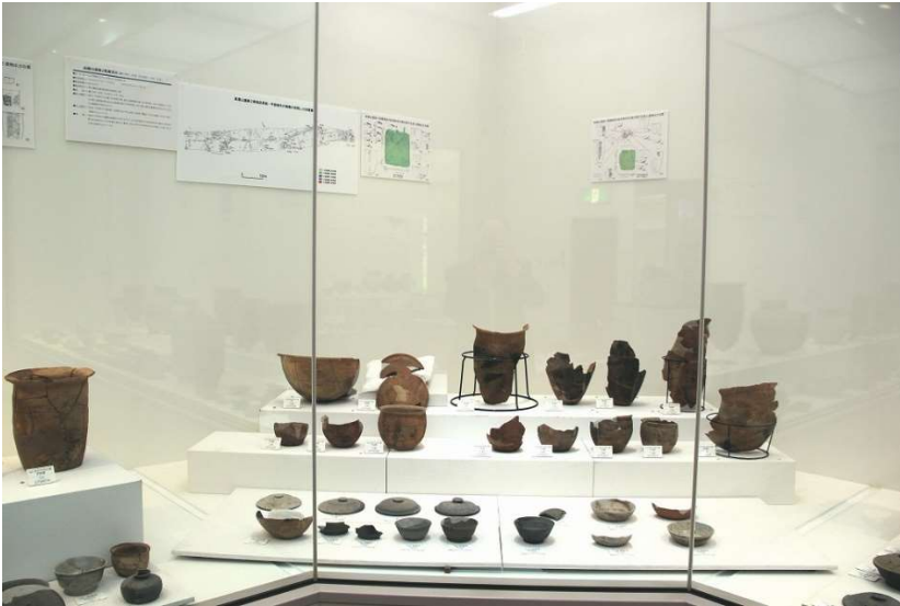
奈良時代の8世紀第4四半期の竪穴住居跡から出土した須恵器、あかやき土器を展示しています。