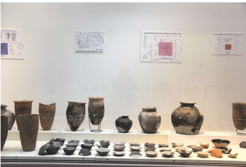
平安時代の9世紀第1・第2四半期の竪穴住居跡から出土した土器を展示しています。