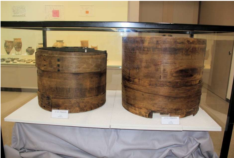
高瀬山遺跡の井戸から出土した大きな曲物（井戸眼）です。