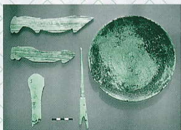
大在家出土の木器 左 馬形・矢形・人形の呪具 右 漆塗り皿

年代はともに出土した土器から考えて、七世紀末から八世紀初めと推定され、当時の生活を物語るだじじな資料である。