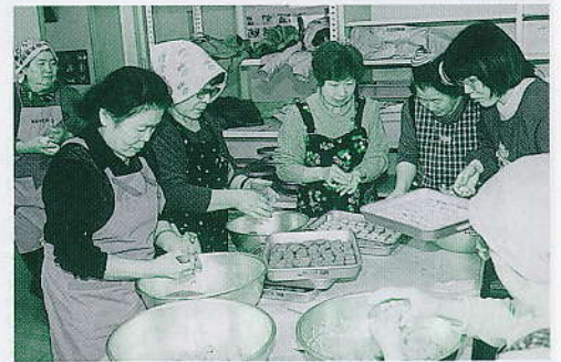
だんごづくり「こねる」

機にかけて穀を取り除かなければならない。摺り圧を変えながら、モロコシとキビは順調に終了。モロコシは赤く、キビは