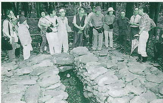
昨年の「北方古代世界への旅」北上市江釣子古墳にて

また昨年から新たに公園管理組合との共催による「古代食試食会」が開かれる予定である。つくって食べる文字どおりの「健康食」。あらためて地域の伝統食を見直していきたいものである。