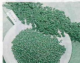
タカキビ (モロコシ)