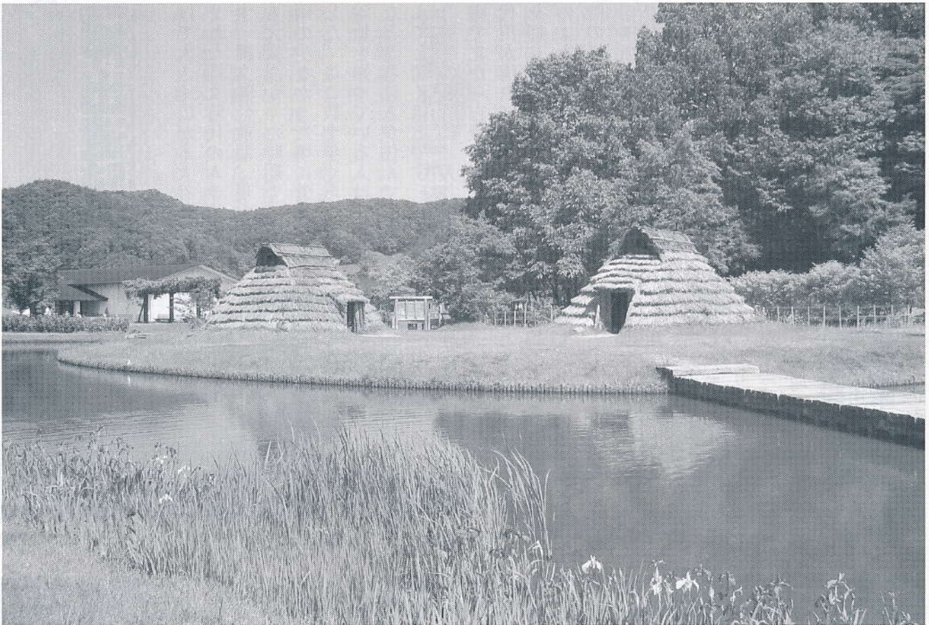
▲補修を終えた復元住居

遺跡の発掘調査は、一般の土木工事と異なり予断を許さない。予想外の成果があるから調査の意義がある。それだけに常に最新の技術と考古学の最前線の研究成果を身につけた調査員が発掘調査にあたる。そのせいか全国各地にある遺跡公園の復元住居は、同じ時代にあっても細部は多様である。発掘調査の成果に裏付けられるからだ。と同時に復元は、発掘調査で分からなかった部分まで踏み込むので一層慎重にならざるを得ない。間違った復元は、見学者の誤解を生むからだ。 さて、当館のある「まほろば古の里歴史公園」の縄文時代竪穴住居跡の復元住居は、高島町金谷遺跡で発見されたものを復元したものである。平成九年当時の考古学研究成果にもとづき、また作業の安全・維持管理をふまえて復元された。 維持管理は安全点検に始まり蜂・蛇の駆除など相当な労力を要する。とくに大変なのは茅の葺き替えて、茅の確保と茅葺き技術者の確保である。茅葺き民家がなくなりつつあるため、どちらでも大変である。寺社も困って茅葺きをやめるところが多い。しかし、竪穴住居跡の復元住居はやめるわけにいかない。茅の確保と茅葺き技術の伝承は大きな課題である。当館だけの問題ではなさそうである。