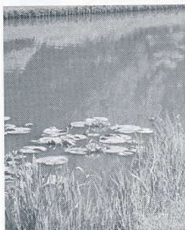
▲カキツバタとスイレン

復元された縄文の竪穴住居の附近のカキツバタは、池のスイレンとともに鮮やかな花を楽しませてくれます。彩の季節、公園を散策して、自然と触れ合ってみませんか。