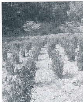
▲棚田わきのアヤマ

奥まった沢には棚田があります。棚田の上には味噌根古墳群や高島石の石切場などがあります。その途中には桜が植樹されています。棚田には紫米や黒米、赤米の古代米が栽培されています。水田稲作が始まった弥生時代からしばらく栽培されてきた米です。棚田の上半分は古代ハスの大賀ハスが植えられ、夏には見事な花を咲かせ、人びとを魅了しています。