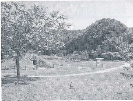
▲クルミの木と古墳

考古資料館の南側駐車場を安久津二号墳の方向に進むと落葉高木のクルミの木があります。五月〜六月にかけて、花が咲き、秋にぶどうの房のように実をつけます。縄文時代から食用として盛んに食べ