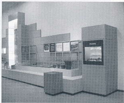
▲常時展示している押出遺跡出土品

けて大きく広がる大谷地に営まれた縄文時代のムラの跡です。縄文時代前期、現在よりも大変温かった時期で、大雨の少なかった頃に営まれた。ここ数十年くらいの大谷地を知っている人は、あんなところに人が住んでいたなんてと驚くほどです。