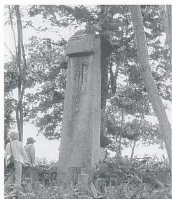
▲ 見上げるほど大きな板碑

堅雪が割れて谷地に沈んでしまった」というものがあり、板碑に使われた石材の産地や運搬の方法などをうかがわせるような興味深い話となっています。