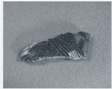
貼絞胎の陶枕の破片

今回の展示では、その代表的な遺跡である城輪柵跡から出土した資料も数多く展示しました。第4回企画展の時にもその一部を展示しましたが、今回は特に、貼絞胎(はりこじょうたい)の陶枕(とらまくら)と