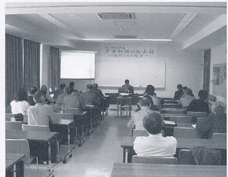
講演会とギャラリートーク

講演会の後は当館館長によるギャラリートークが行われ、実際に展示を見ながらの解説は、理解が深まったようです。