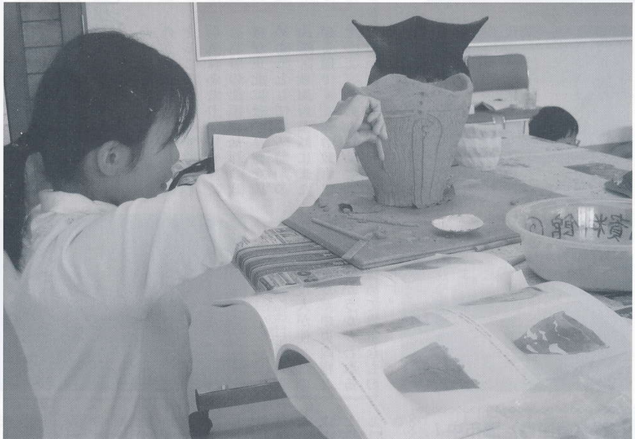
▲ 縄文土器作り（平成 17 年度文化体験プログラムより）

山形県東置賜郡高島町大字安久津 2117 TEL 0238 - 52 - 2585 FAX 0238 - 52 - 4665