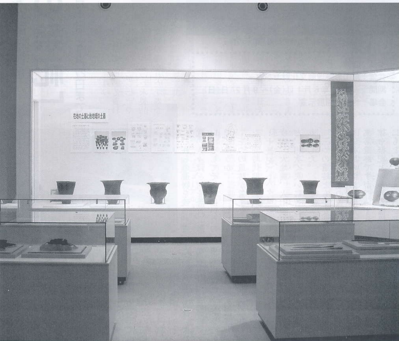
▲改装後最初の展示となった押出遺跡出土の土器

山形県東置賜郡高畠町大字安久津 2117 TEL 0238 - 52 - 2585 FAX 0238 - 52 - 4665