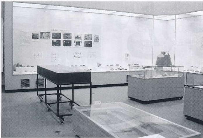
▲特別テーマ展「古代の祭祀」展示の様子

に「人形（ひとがた）」や「武器形」といった木製品や顔や文字が書かれた土器などがあります。